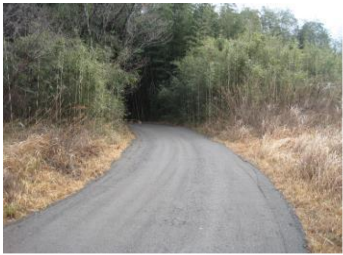
現場 作業通路整備