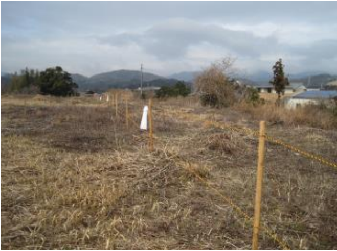
現場北側の 立ち入り禁止のロープ張