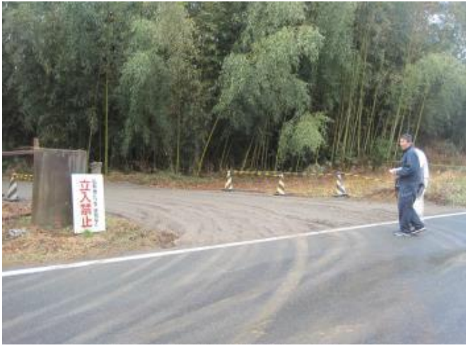
現場の出入り口 整備